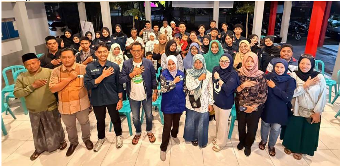
Gambar 4. Sosialisasi dan penyerahan website Desa Jubung

ini ditandai dengan peluncuran website Desa Jubung yang telah terisi dengan berbagai data seperti pariwisata, event desa, akomodasi, dan profil UMKM Desa Jubung. Selain itu, kegiatan ini dilanjutkan dengan pemberian sosialisasi dan pelatihan kepada perangkat desa terkait penggunaan dan pemeliharaan website. Penyerahan guidebook admin website Desa Jubung yang berfungsi sebagai panduan operasional, diberikan kepada perangkat desa agar program digitalisasi dapat berlanjut secara mandiri. Namun, meskipun sudah menyerahkan website seutuhnya ke pihak perangkat Desa Jubung, mahasiswa PMM Desa Jubung tetap mengawasi penggunaan website untuk sementara waktu hingga perangkat desa Jubung mandiri dalam keberlanjutan digitalisasi pariwisata dan UMKM untuk kemajuan Desa Jubung.