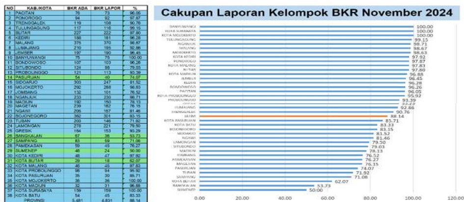
Gambar 2.1 Cakupan Laporan Kelompok BKR Terhitung Hingga Bulan November 2024