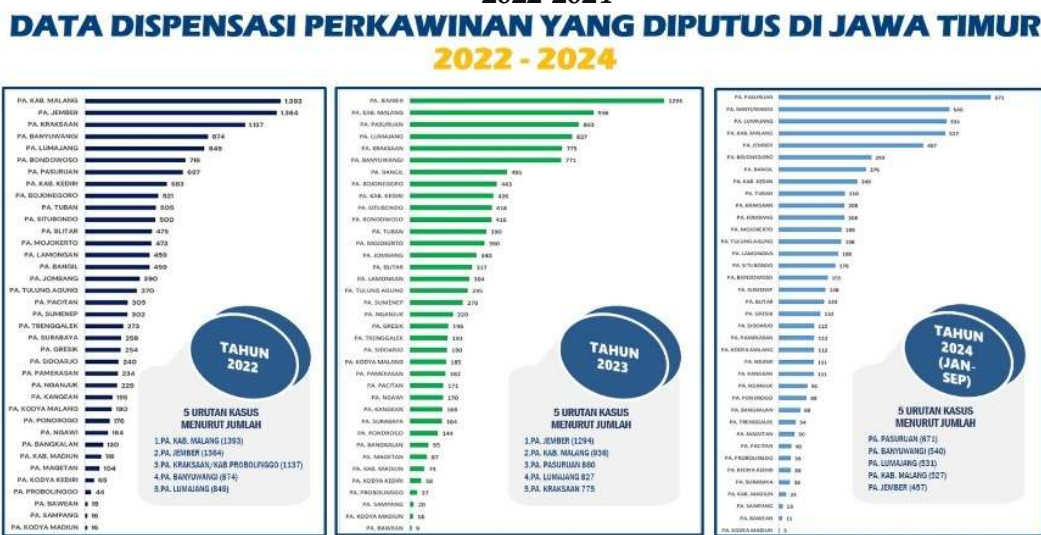
Sumber : Pengadilan Tinggi Agama Surabaya, 2022-2024 (Januari-September)

BerAKHLAK DP3AK_JATIM @dp3akjatim.official dp3ak.jatimprov.go.id (031) 99842454