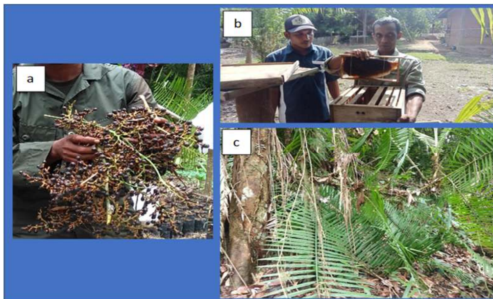
Gambar 2. Produktivitas hutan HKm Alue simantok, (a) jernang, (b) Madu (c) Rotan. (Figure 4, Forest productivity of HKm Alue simantok, (a) jernang, (b) Honey (c) Rattan).

Dilihat dari dampak Ekologi dan lingkungan terhadap Hutan Kemasyarakatan (HKm) Alue Simantok, menunjukkan bahwa Anggota KTH memahami dari fungsi menjaga kelestarian ekosistem HKm Alue Simantok. Ada berbagai cara yang sudah dilakukan dalam pengelolaan HKm Alue Simantok, dan Upaya yang dilakukan telah diterapkan berdasarkan Peraturan Menteri LHK tahun 2021 tentang pengelolaan perhutanan sosial dimana telah dilakukan penanaman Kembali, dilakukan sistem tebang pilih sehingga mengurangi dampak penebangan hutan secara liar dan dalam jumlah besar-besaran. Selain itu system ini juga berguna untuk masyarakat agar tidak sembarang dalam melakukan penebangan hutan. anggota KTH HKm alue simantok telah menetapkan sanksi administrasi bagi anggota yang melanggar aturan yang ditetapkan, disamping adanya kearifan lokal yang diterapkan untuk melindungi dan mengelola lingkungan hutan secara lestari.