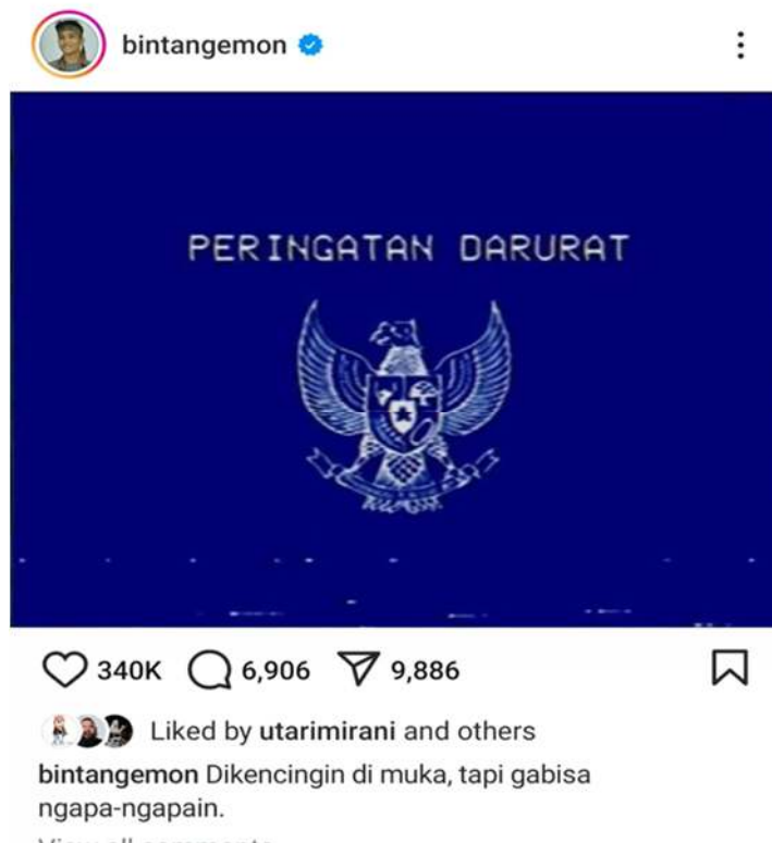
Gambar 3. Peringatan Darurat Penolakan Revisi UU No. 10 Tahun 2016 Pasal 7 ayat (2)

Gambar diatas yang diposting oleh salah satu tokoh public, seorang komedian muda yang ikut dalam partisipasi aksi protes melalui media instgram pada tanggal 21 Agustus 2024. Unggahan tersebut berhasil menjadi symbol kekuatan digitalisasi dalam meningkatkan kesadaran dan partisipasi politik, terutama dikalangan mahasiswa. Dengan lebih dari 340 ribu tanda suka dan ribuan komentar, postingan ini menunjukkan bahwa media social telah menjadi alat yang efektif untuk menyampaikan pesan politik kepada khalayak luas. Dengan aksi protes ini memberikan dampak yang cukup luas sehingga dapat mempengaruhi keputusan Mahkamah Konstitusi yang menolak revisi UU No, 10 Tahun 2006 ini (Ginting et al., 2024).