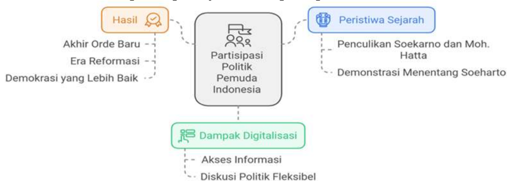
Gambar 1. Visualisasi Grafis Partisipasi Politik Mahasiswa Dan Generasi Muda

Masuk pada zaman digitalisasi sekarang ini, memberikan jalan baru terhadap partisipasi politik mahasiswa. Perluasan akses untuk mendapatkan informasi memberikan ruang yang lebih fleksibel kepada mahasiswa untuk melakukan partisipasi politiknya seperti melakukan diskusi politik tanpa ada batasan waktu dan tempat. Hal ini menjadi kemajuan yang bisa meningkatkan lagi peran aktif mahasiswa dan generasi muda dalam partisipasinya terhadap isu politik di Indonesia.