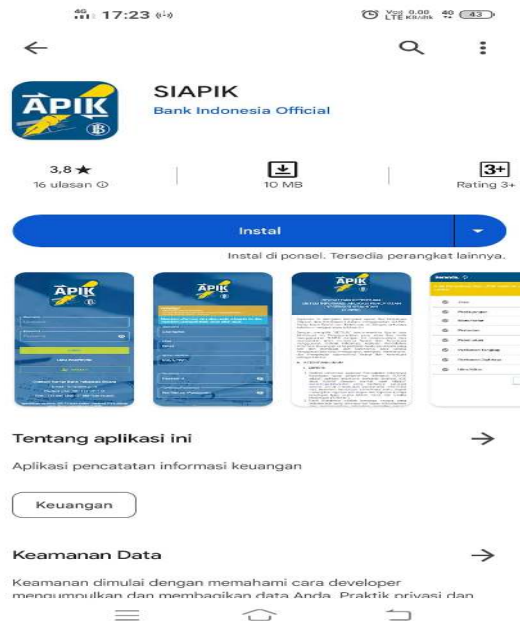
Gambar 1. Tampilan Aplikasi SI APIK di Google PlayStore