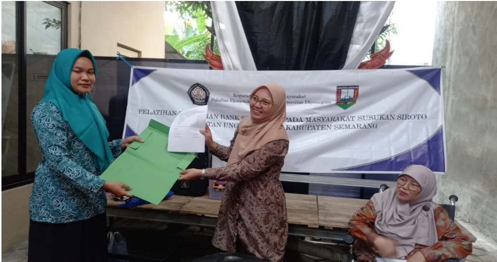
Gambar 6. Serat Terima Berita Acara Barang yang Didonasikan kepada Masyarakat RT 6 RW 2 Susukan Siroto, Ungaran Timur, Kab. Semarang

Hasil dari pelatihan tersebut, saat ini masyarakat RT 6 RW 2 Susukan Siroto sudah melakukan pilah sampah.