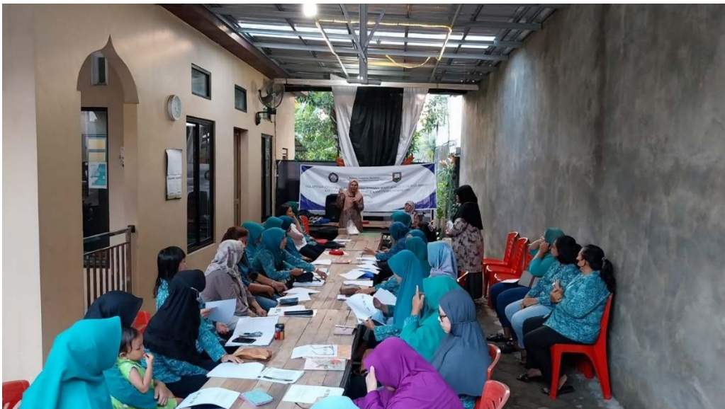
Gambar 3. Paparan Tim Pengabdian Masyarakat

Kegiatan pengabdian ini akan terus dilanjutkan dengan pendampingan masyarakat dalam menyelenggarakan bank sampah dengan baik. Saat ini masyarakat sudah mulai memilah sampah organik dan anorganik. Kegiatan pengabdian ini tidak hanya dilakukan dalam 1 hari, namun berkelanjutan sampai bulan Juni 2024, di mana terdapat pendampingan pelaksanaan bank sampah di wilayah setempat. Adapun foto-foto kegiatan adalah sebagai berikut.