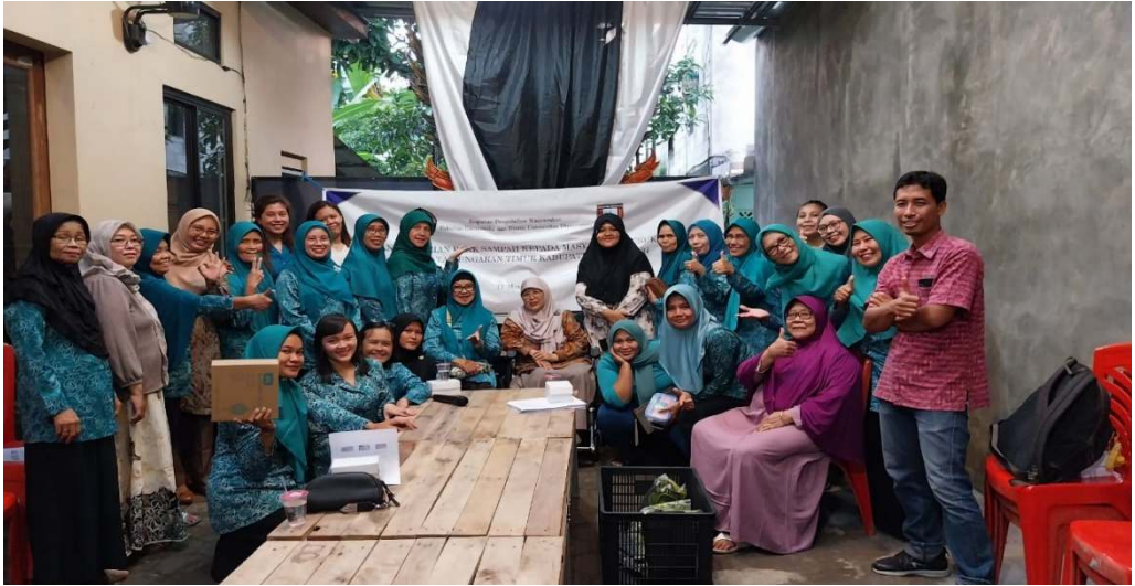
Gambar 4. Foto Bersama Tim Pengabdian Masyarakat dengan Peserta