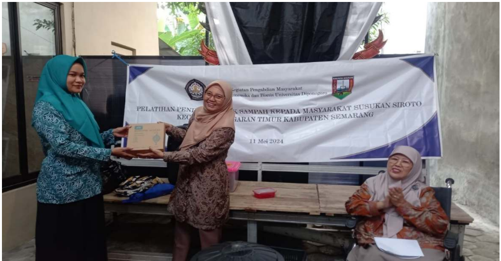
Gambar 5. Serah Terima Simbolis Timbangan Gantung untuk Ssampah dari Tim Pengabdian Masyarakat kepada Ibu RT