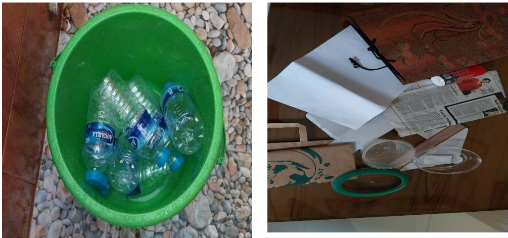
Gambar 7. Sampah Anorganik yang Sudah Dipilah Warga

Hasil dari pelatihan tersebut, saat ini masyarakat RT 6 RW 2 Susukan Siroto sudah melakukan pilah sampah.