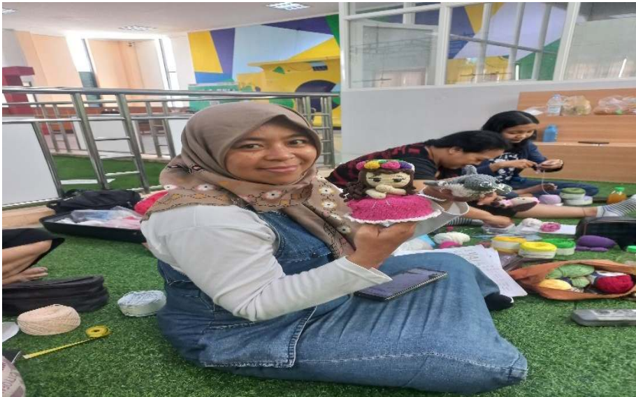
Gambar 5 foto gantungan kunci hasil rajut