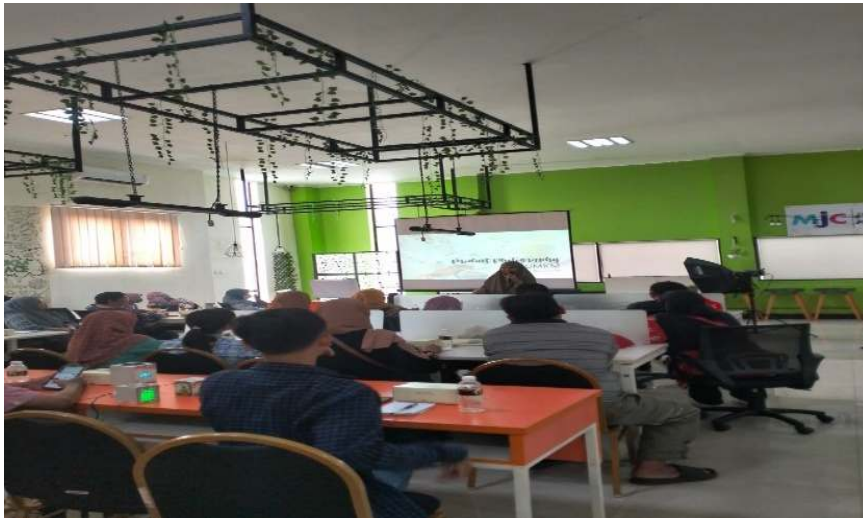
Gambar 6 foto pelatihan dan sosialisasi program

Peran seorang ibu sebagai pendamping suami dan mengelola rumah tangga saat ini layak diperhitungkan dan perlu dikembangkan dalam mensejahterakan keluarga (Ningsih, 2021). Seorang ibu juga sebaiknya bisa mandiri, tidak hanya tergantung pada suami. Seorang ibu yang mandiri adalah pribadi yang secara proaktif mengambil tindakan-tindakan tertentu untuk mendukung dan membina rumah tangganya. Wirausaha perempuan perlu didukung untuk meningkatkan kesejahteraan keluarga. Hal itulah yang mendasari ibu-ibu PKK disini yang berkeinginan untuk meningkatkan taraf hidup keluarga melalui kerajinan Merajut. Perempuan wirausaha juga dinilai lebih bertanggung jawab dan profesional dalam mengelola keuangan (Puspitawati, 2012). Pemerintah maupun perbankan pun telah mendukung para wirausahawan dan wirausahawati melalui pemberian akses keuangan. Akses tersebut diharapkan dapat memberi kesempatan bagi para wirausaha dalam mengembangkan usahanya (Mustikowati et al., 2022). Kaum perempuan merupakan kelompok yang proaktif dan dalam situasi tertentu serta berani mengambil inisiatif terutama menghadapi situasi sosial ekonomi yang berkaitan langsung dengan peningkatan kesejahteraan dan kualitas hidup keluarganya. Tentunya para