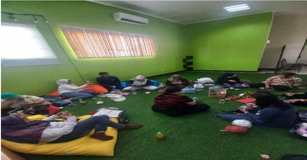
Gambar 3. proses pendampingan dalam merajut