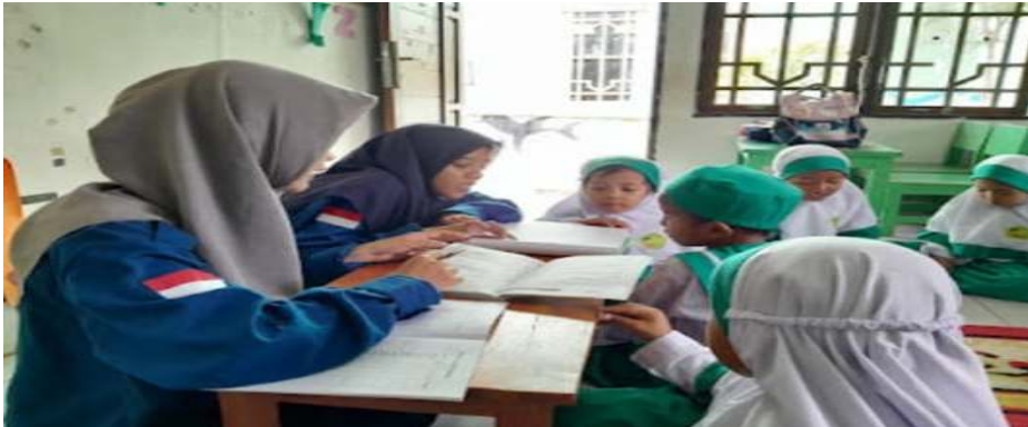
Gambar 1. Tim Pelaksana Pengabdian sedang membimbing siswa untuk membaca