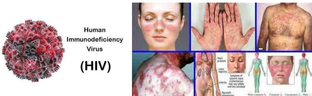
Gambar 5. penyakit Menular Seksual

Risiko tertularnya PMS seperti HIV/AIDS, gonore, sifilis, dan infeksi lainnya. Remaja yang tidak memiliki akses atau pengetahuan tentang kontrasepsi berisiko mengalami kehamilan yang tidak diinginkan, yang dapat berdampak negatif pada pendidikan, kesejahteraan emosional, dan masa depan mereka. Bila tidak menjaga kesehatan reproduksi yang tepat dapat meningkatkan risiko komplikasi seperti infeksi saluran reproduksi, kanker serviks, masalah menstruasi, dan gangguan reproduksi lainnya.