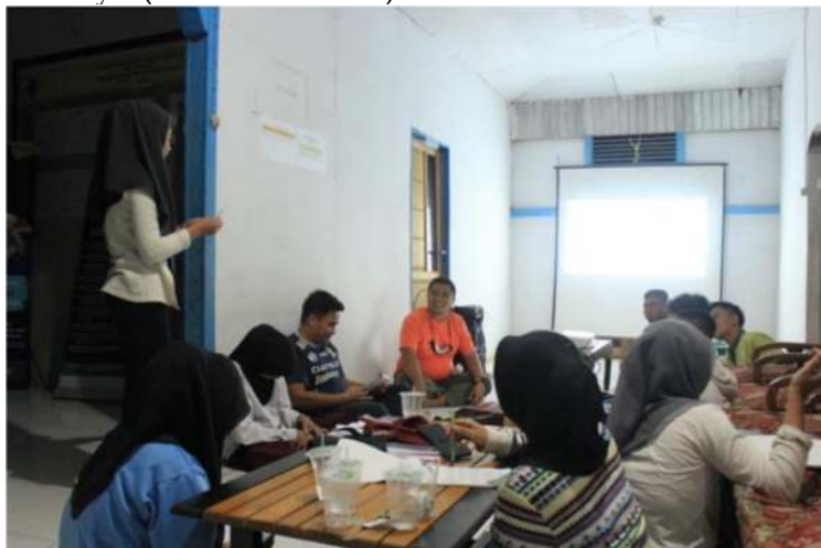
Gambar 3. Sesi Presentasi Informasi Paket Wisata

Paket wisata yang dibuat akan menjadi salah satu produk jasa bagi unit usaha yang akan dijalankan oleh pengelola desa wisata Temajuk. Paket wisata yang dimaksud adalah paket wisata liburan dan paket wisata petualang sesuai dengan potensi yang ada. Setelah paket wisata dibuat, selanjutnya adalah praktik penyajian informasi dalam paket wisata. Setiap peserta melakukan presentasi untuk menjelaskan paket wisatanya (lihat Gambar 3).