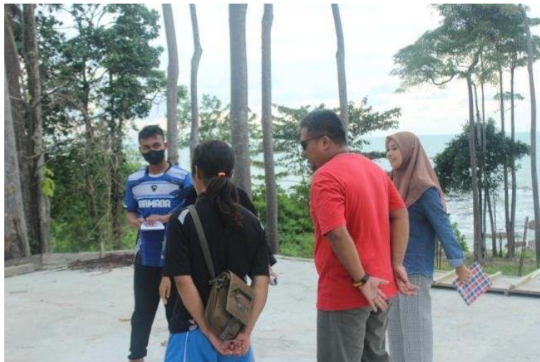
Gambar 6. Simulasi memimpin rombongan wisata

Pemimpin rombongan atau tour leader adalah seseorang yang diberi amanah untuk memimpin suatu perjalanan wisata ( tour ) di dalam ataupun luar negeri (Yoeti, 2014). Tujuan praktik ini adalah agar pemandu wisata lokal bisa merasakan pengalaman langsung sebagai tour leader dengan membawa dan memimpin rombongan di beberapa titik destinasi wisata Temajuk. Praktik memimpin rombongan dilakukan oleh pramuwisata lokal dengan berkelompok (3 orang per kelompok) dengan membawa tamu ke destinasi sesuai paket tour yang dipesan. Simulasi dilakukan di beberapa titik yakni Hobit Home, Batu Nenek, dan Mangrove dengan meeting point di penginapan J.L.O. Kegiatan praktik ini ditunjukkan dalam Gambar 6 berikut.