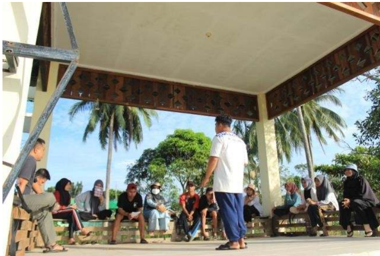
Gambar 5. Simulasi story telling

Tujuan pelatihan ini adalah agar pemandu wisata lokal mampu bercerita dengan terstruktur dan baik sehingga informasi yang disampaikan mudah dipahami wisatawan dengan baik. Parengkuan menyebutkan bahwa storytelling adalah salah satu daya pikat utama dalam seni berbicara, khususnya dalam public speaking (Sulistyo & Arswendi, 2022). Storytelling akan mempermudah audiens untuk mencerna bila 'cerita' pramuwisata 'terhubung' dengan materi yang disampaikan. Tidak hanya itu, cerita yang disampaikan harus mengandung emosi, sehingga wisatawan yang mendengarkan menjadi antusias terhadap informasi yang akan disampaikan oleh pramuwisata. Dalam pendampingan ini, peserta diberi kesempatan untuk meningkatkan kapasitas storytelling menggunakan ciri khas masing-masing sebagai bagian dari personal branding pramuwisata. Hal ini pada gilirannya akan menguatkan dan memberdayakan masyarakat lokal sebagai pelaku utama wisata di daerahnya sendiri (Mutiaraningrum & Meniwati, 2021). Materi yang diajarkan kepada peserta adalah teknik bercerita dengan alur 5W+1H.