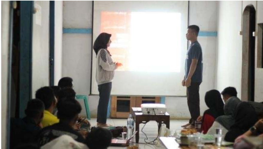
Gambar 1 Simulasi Penerapan SOP Pramuwisata