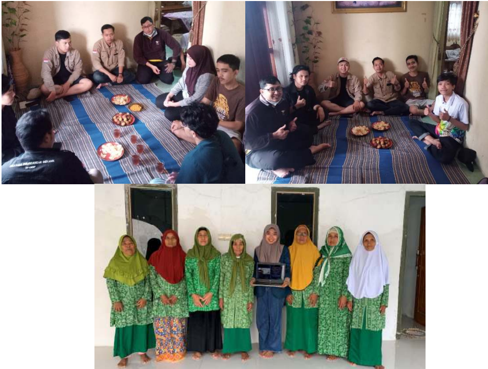
Gambar 1. Dokumentasi Kegiatan Sosialisasi Sedekah sebagai Fondasi Pembangunan Berkelanjutan di Desa Pagelaran, Pemalang

Lebih lanjut, Duernecker dan Sanchez-Martinez (2023) lebih lanjut mendefinisikan ulang structural change sebagai adanya pertumbuhan produktivitas dikarenakan adanya realokasi aktifitas ekonomi dari sektor yang memiliki produktifitas tinggi ke sektor yang memiliki produktivitas yang relatif rendah. Oleh karena itu, konsep ini mengintegrasikan peningkatan produktivitas dalam definisi perubahan struktural, yang menyiratkan bahwa penelitian ini memiliki kecenderungan untuk menemukan korelasi positif antara perubahan struktural dan pertumbuhan.