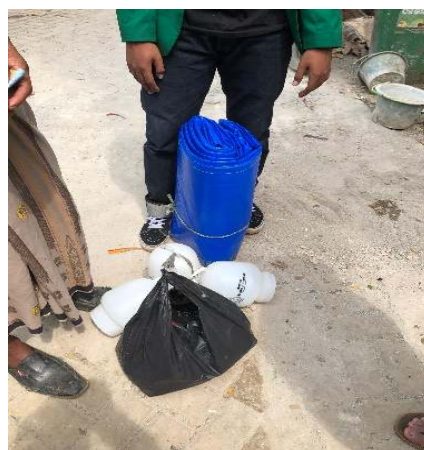
Gambar 4: Penyerahan dari hasil donasi