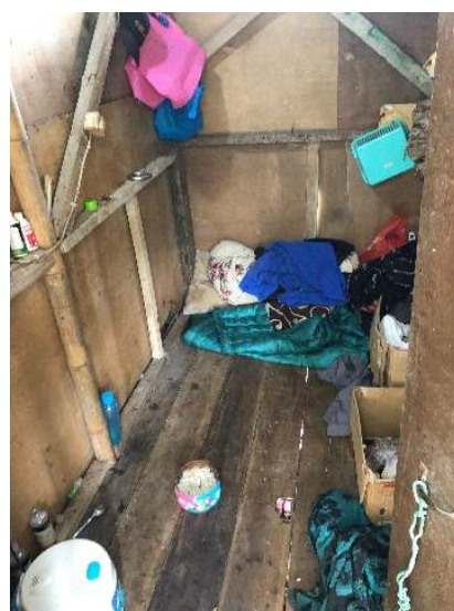
Gambar 1: Survei lokasi dhuafa