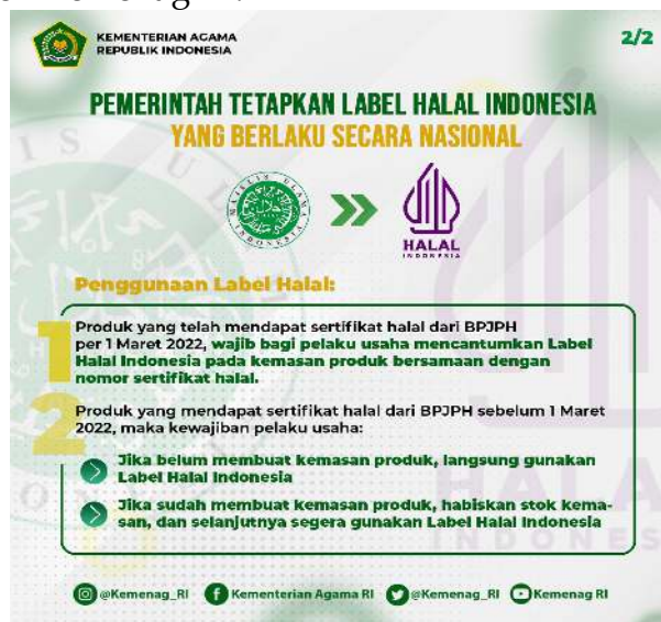
Gambar 1. Regulasi tentang Penggunaan Logo Baru Label Halal Indonesia

Kementerian Agama Republik Indonesia (Kemenag RI), pada tahun 2022 menginformasikan secara resmi mengenai regulasi tentang “Badan Penyelenggara Jaminan Produk Halal (BPJPH)”. Regulasi tersebut, secara normatif tertera dalam Surat Keputusan Kepala BPJPH No. 40 Tahun 2022 tentang Penetapan Label Halal (Lubis & Permata, 2022). Secara umum, dalam Surat Keputusan tersebut dijelaskan bahwa mulai dari 1 Maret 2022 penetapan Produk Jaminan Halal (JPH) dilakukan oleh BPJPH dengan mencantumkan logo baru Label halal Indonesia yang sudah dirilis oleh Kemenag RI (Khoeron, 2022). Berkenaan dengan logo baru Label Halal Indonesia tersebut, berikut merupakan infografis tentang transformasi logo lama Label Halal dari Majelis Ulama Indonesia (MUI) menjadi logo baru Label Halal Indonesia yang dirilis oleh Kemenag RI: