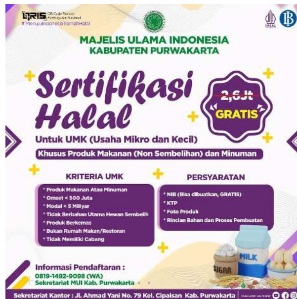
Gambar 7. Informasi tentang Pelayanan Sertifikasi Halal Produk Non Daging di MUI Purwakarta

Gambar 7 di atas, menunjukkan informasi lengkap mengenai pelayanan sertifikasi Halal yang diberikan MUI Kabupaten Purwakarta secara gratis. Biasa diamati pada Gambar 7 di atas, sekurang-kurangnya ada dua poin informasi penting yang terdapat dalam flyer tersebut, yaitu Kriteria UMK dan Persyaratan. Tampak pada flyer tersebut ada beberapa persyaratan bagi UMK (Usaha Mikro dan Kecil) yang akan mengajukan sertifikasi Halal khusus untuk produk makanan (non sembelihan) dan minuman. Kriteria UMK tersebut ialah (1) Produk makanan atau minuman; (2) Omset < 500 jua; (3) Modal < 5 Milyar; (4) Tidak berbahan utama hewan sembilan; (5) Produk berkemasan; (6) Bukan rumah makan/restoran; (7) Tidak memiliki cabang. Selanjutnya dalam flyer tersebut, terdapat juga persyaratan yang perlu dilengkapi oleh pelaku usaha yang akan mengajukan sertifikasi Halal. Persyaratan tersebut adalah: (1) NIB (Bisa dibuatkan, Gratis); (2) KTP; (3) Foto produk; (4) Rincian bahan dan proses pembuatan. Terakhir, pada flyer itu juga terdapat nomor kontak informasi pendaftaran produk dan alamat lengkap sekretariat kantor MUI Kabupaten Purwakarta.