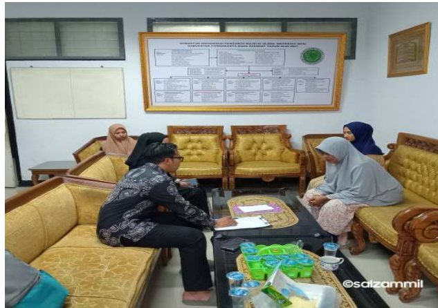
Gambar 5. Sosialisasi dan Penjelasan Tahapan Sertifikasi Halal di MUI Kabupaten Purwakarta

harus ditempuh dalam mengajukan sertifikat Halal untuk produk non daging bagi pelaku UMKM: