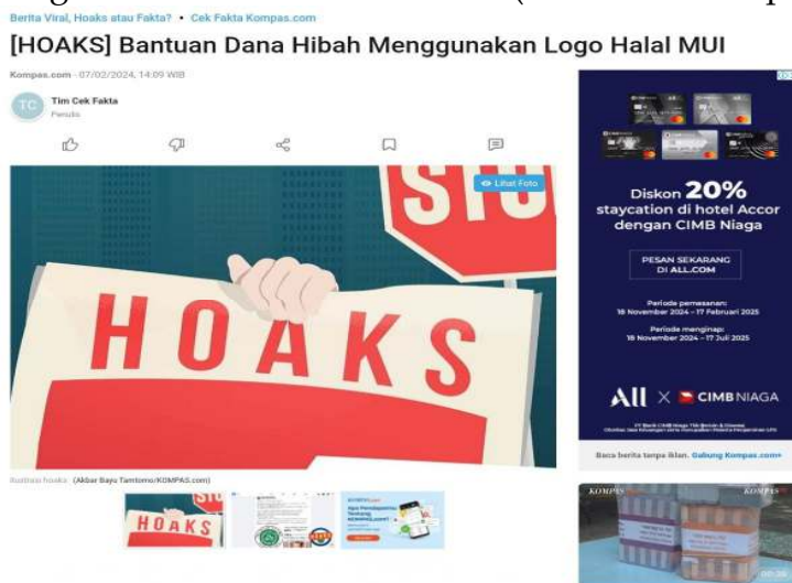
Gambar 3. Hoax tentang Sertifikat Halal

Ketiga , adanya informasi tidak benar ( hoax ) yang tersebar di masyarakat mengenai Sertifikat Halal. Ada hoax yang menyebar di tengah masyarakat yang menyatakan bahwa sertifikat Halal tersebut dapat digunakan untuk mendapatkan dana bantuan hibah atau sebagai jaminan pinjaman dan modal usaha. Permasalahan yang ketiga ini, menambah bingung dan misinformation bagi para pelaku UMKM. Banyak para pelaku UMKM di Kabupaten Purwakarta, yang “termakan” informasi hoax tersebut. Berkenaan dengan informasi hoax mengenai sertifikasi Halal ini, berikut adalah fakta yang berhasil diungkap oleh Kompas mengenai informasi hoax tersebut (Cek Fakta Kompas, 2024):