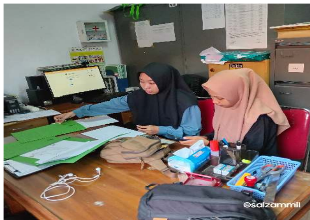
Gambar 6. Pelayanan Sertifikasi Halal pada Tahap Pengumpulan dan Pengunggahan Dokumen

Demikian itulah tiga tahapan yang menjadi fokus pelayanan yang diberikan dan dilaksanakan oleh Mahasiswa Praktikan PPL sebagai Pelaksana Kegiatan PKM di MUI Purwakarta dalam pelayanan sertifikasi Halal produk non daging. Secara keseluruhan, tahapan pelayanan sertifikasi Halal produk non daging bagi pelaku UMKM di MUI Kabupaten Purwakarta ini, telah terlaksana dengan baik dan telah mencapai hasil yang sesuai dengan yang yang direncanakan sebelumnya. Berkenaan dengan tahapan pelayanan sertifikasi Halal produk non daging di MUI Purwakarta yang dilaksanakan oleh Mahasiswa Praktikan PPL seperti yang telah diuraikan di atas, maka di bawah ini adalah gambaran umum dan kondisi objektif pada saat Mahasiswa Praktikan PPL pada saat melakukan pengumpulan dan pengunggahan dokumen dari para pelaku usaha ke laman ptps.halal.go.id untuk pengajuan sertifikat Halal: