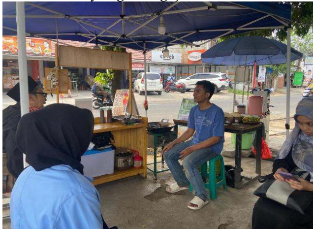
Gambar 8. Proses Verifikasi Produk Non Daging dengan Cara Terjun Langsung ke Tempat Usaha

untuk memeriksa produk milik pelaku UMKM yang akan diajukan sertifikasi Halalnya. Maka dari itu, pelayanan verifikasi yang dimaksud dalam konteks ini ialah membantu dan melayani pemeriksaan produk non daging yang akan diajukan sertifikat Halalnya. Berhubungan dengan pelayanan dalam proses verifikasi ini, berikut adalah gambaran umum dan kondisi objektif pada saat Mahasiswa Praktikan PPL melakukan verifikasi dengan cara terjun langsung ke tempat-tempat usaha milik pelaku usaha yang mengajukan sertifikasi Halal: