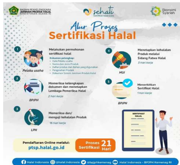
Gambar 4. Alur Proses Sertifikasi Halal

Gambar 4 di atas menunjukkan secara singkat alur proses pengajuan sertifikasi Halal. Berdasarkan informasi yang terdapat dalam Gambar 4 di atas, maka dapat diketahui bahwa secara keseluruhan alur proses pengajuan sertifikasi Halal tersebut, terdiri dari lima tahap. Adapun lima tahap dalam alur proses sertifikasi Halal, secara lengkap dapat diuraikan sebagai berikut: Pertama , melakukan permohonan sertifikasi Halal. Tahap pertama ini dilakukan oleh pelaku usaha yang akan mengajukan sertifikasi Halal, oleh karena ada beberapa dokumen yang harus disiapkan, yaitu: (1) Data Pelaku Usaha; (2) Nama dan Jenis Produk; (3) Daftar Produk dan Bahan yang Digunakan; (4) Pengolahan Produk; (5) Dokumen Sistem Jaminan Produk Halal. Kedua , memeriksa kelengkapan dan menetapkan Lembaga Pemeriksa Halal. Tahap kedua ini dilakukan BPJPH dengan estimasi waktu 2 hari kerja. Ketiga , memeriksa dan menguji kehalalan produk. Tahap ketiga ini dilakukan oleh Lembaga Pengujian Halal (LPH) dengan estimasi waktu 15 hari kerja. Keempat , menetapkan kehalalan produk melalui Sidang Fatwa Halal. Tahap keempat ini dilakukan oleh MUI dengan estimasi waktu 3 hari kerja. Kelima , menerbitkan sertifikat Halal. Tahap kelima ini dilakukan oleh BPJPH dengan estimasi waktu 1 hari kerja.