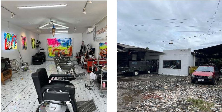
Gambar 2. Melakukan Survey Lokasi

berkaitan dengan tujuan kegiatan. Setiap hasil pengabdian masyarakat harus dibahas.