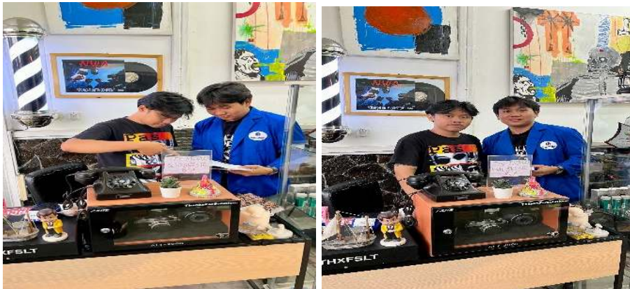
Gambar 3. Pelatihan Laporan Keuangan dan Pemasaran

Tahap kedua yang dilakukan pada tanggal 21 Oktober 2024 melakukan kegiatan pelatihan laporan keuangan sederhana dan pemasaran produk. Kegiatan ini dilakukan dengan memberikan materi tentang laporan keuangan dan pemasaran pada media sosial