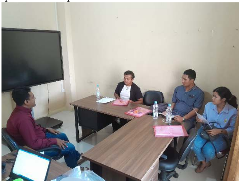
Gambar 2. Koordinasi dan Penyamaan Persepsi

Tahapan pertama dalam kegiatan ini adalah melakukan koordinasi dengan Camat Sungai Bahar. Anggota melakukan koordinasi mengenai keberlanjutan dari program pada tahun sebelumnya. Selanjutnya, setelah adanya koordinasi dan pendalaman permasalahan yang telah dianalisa dari program tahun sebelumnya, maka pada tahapan ini dilakukan penyamaan persepsi mengenai fokus utama serta persiapan pemercalaan permasalahan.