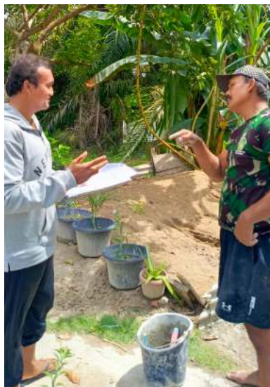
Gambar 3. Kegiatan Dokumentasi Ingatan

Dokumentasi ingatan warga Sungai Bahar dilakukan oleh mahasiswa dengan merujuk pada daftar pertanyaan yang telah dibuat. Mahasiswa disebar ke seluruh unit atau desa di Sungai Bahar. Masing-masing unit atau desa ditargetkan setidaknya-tidaknya akan mendapatkan dua narasumber yang merupakan penghuni awal atau yang menyaksikan awal terbentuknya perkebunan atau pemukiman di masing-masing unit. Hal ini dilakukan untuk memetakan terbentuknya desa atau unit karena setiap desa atau unit dibentuk tidak bersamaan. Kriteria lanjutan mengenai narasumber tidak boleh yang berasal dari satu rumah. Pemilihan semacam ini untuk mencari variasi ingatan.