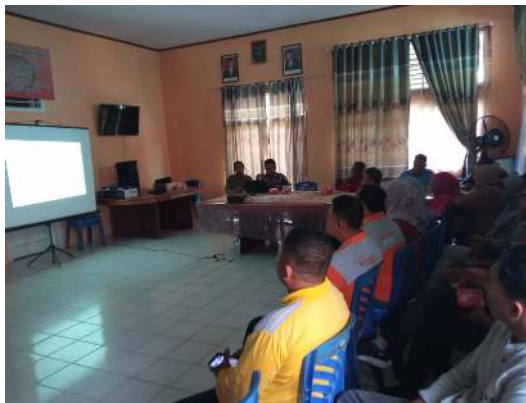
Gambar 5. Kegiatan Sosialisasi dan Diskusi Hasil Dokumentasi

Launching dokumentasi kegiatan dilakukan di kantor kecamatan Sungai Bahar. Kegiatan ini dilakukan setelah adanya tahap seleksi dokumentasi ingatan serta melakukan pengelompokan hasil dokumentasi berdasarkan desa.