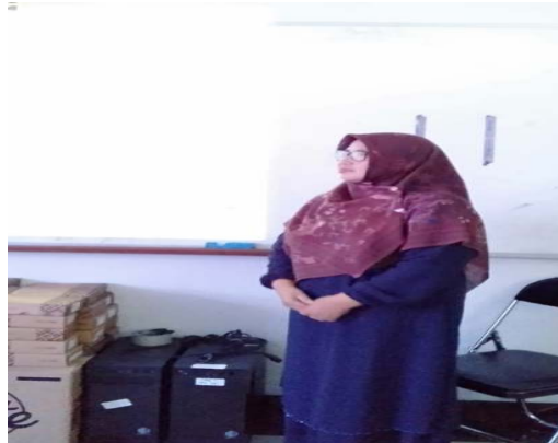
Gambar 1. Sambutan ketua abdimas

Kegiatan pengabdian masyarakat ini merupakan bukti nyata dari komitmen para dosen IBIK 57 untuk membantu masyarakat. Dengan berbagi pengetahuan dan sumber daya, kami berharap dapat membantu memajukan potensi individu dan masyarakat secara keseluruhan. Oleh karena itu, atas nama tim, ketua tim abdimas sangat mengapresiasi keikutsertaan peserta dalam kegiatan ini dan berharap mendapatkan manfaat yang besar. Selanjutnya para peserta melakukan diagnostic assessment , tujuannya adalah untuk mengidentifikasi kekuatan dan kelemahan peserta dalam keterampilan yang berhubungan dengan TOEFL.