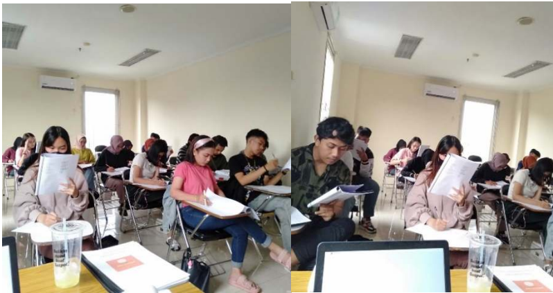
Gambar 2. Peserta pelatihan TOEFL Preparation

menghadapi setiap bagian ujian, seperti Reading, Listening, Speaking, dan Writing. Kegiatan ini meliputi teknik menjawab soal, manajemen waktu, dan cara memaksimalkan skor TOEFL